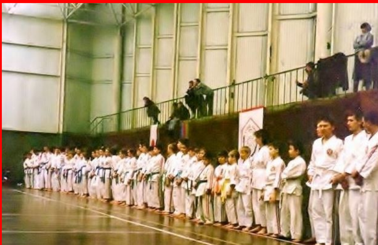
Фрагмент 1-го чемпионата по Косики каратэ. СССР. Год 1991.

В начале 90-х годов 20-го столетия М.В.Крысиным был создан для развития Косики каратэ в нашей стране, а затем и зарегистрирован (1991) Центр развития Косики каратэ .